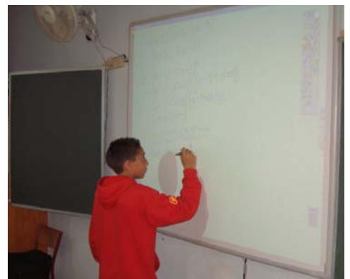
Un élève qui rédige la solution d'un exercice

Conclusion : Depuis le mois de février 2005, j'utilise le TBI et aujourd'hui, je ne me vois absolument pas ne pas l'utiliser, tellement il a apporté de puissance, de rapidité et de souplesse dans mon travail. L'effet auprès des élèves est immédiat, ils manifestent un intérêt certain pour cette nouvelle technologie et me